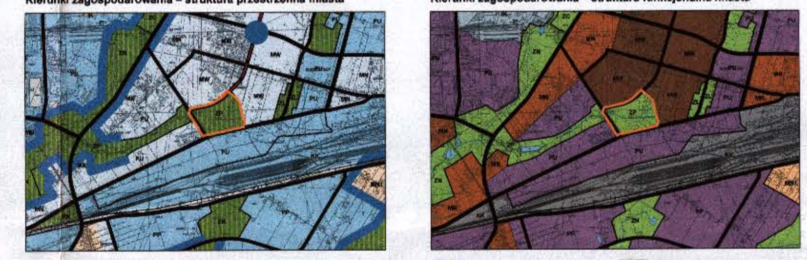
WYRYS ZE STUDIUM UWARUNKOWAŃ I KIERUNKÓW ZAGOSPODAROWANIA PRZESTRZENNEGO MIASTA ŁODZI Łódź dnia 12.02.2016 r. Rada Miejska w Łodzi z dnia 27 października 2016 r.