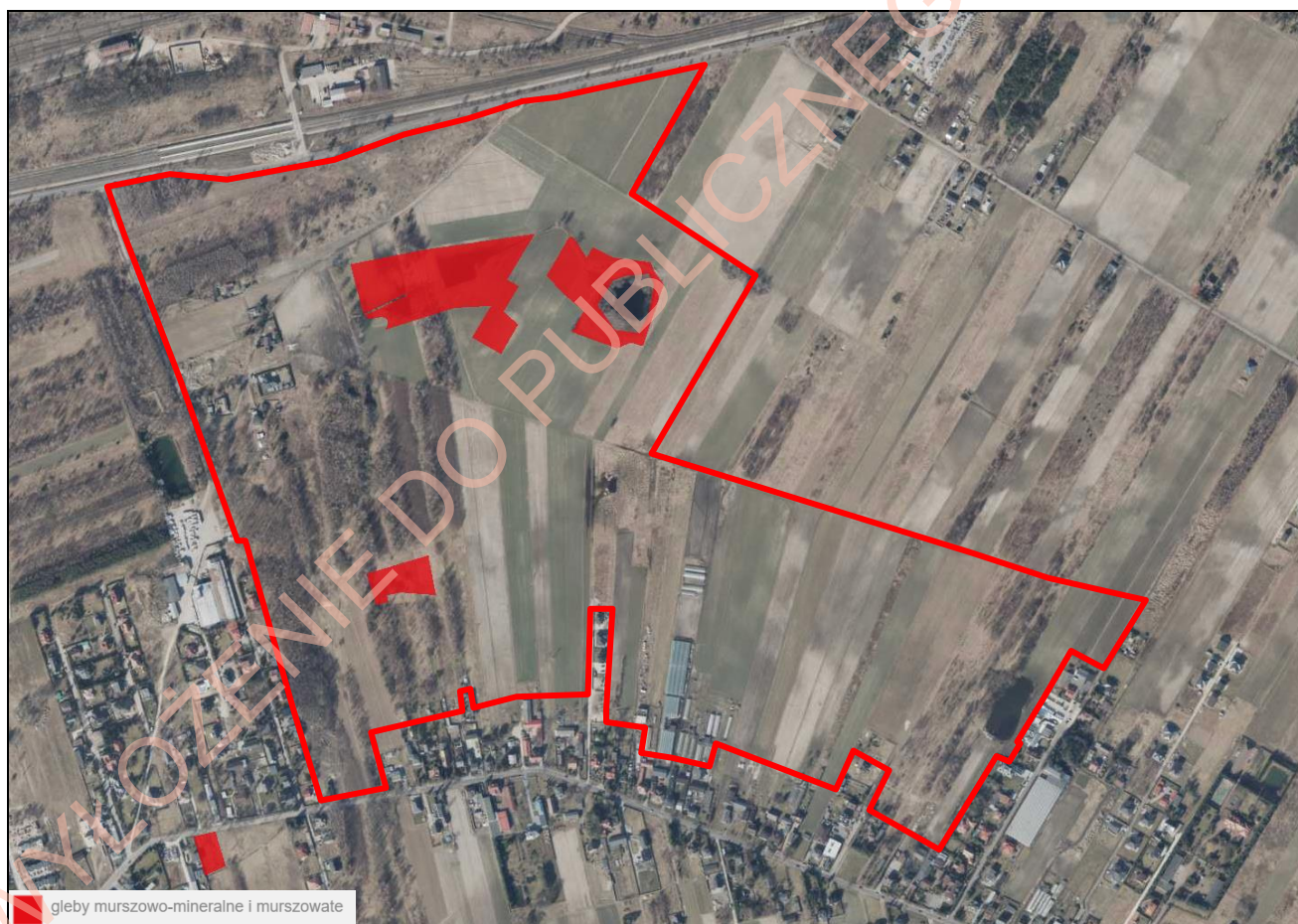
Rys. 2. Gleby pochodzenia organicznego na obszarze objętym opracowaniem, Geoportal Województwa Łódzkiego

Na analizowanym obszarze występują gleby pochodzenia organicznego: gleby murszowo-mineralne i murszowate – głównie w obszarze użytku ekologicznego „Jeziorko Wiskitno”.